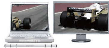
[プライマリーモード]