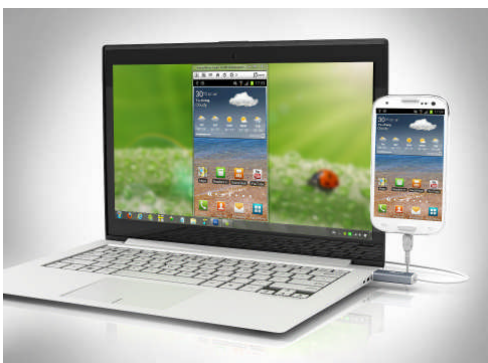
[スクリーンミラー機能]

USB 接続したアンドロイドスマートフォン、アンドロイドタブレット端末の画面がそのまま PC のディスプレイにミラー表示できます。表示された画面の拡大、縮小も可能。スマホ、タブレットの動きに連動した回転表示機能も搭載しています。