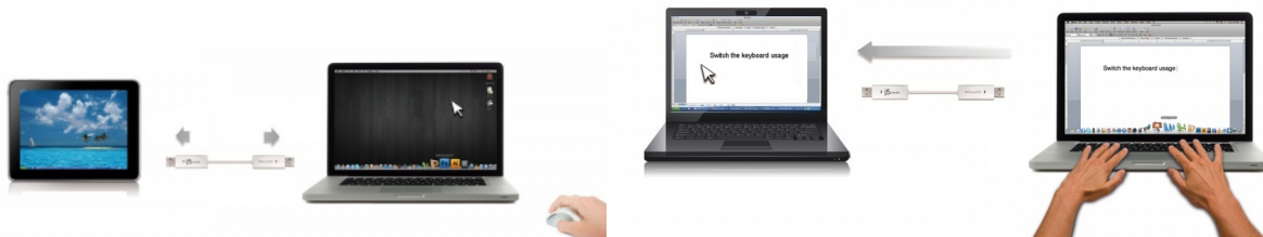
[マウスの共有のイメージ]

wormhole switchで接続された2台のPC間で、マウス操作、キーボード入力がどちらからでも操作できます。片方のマウス、キーボードで両方のPC操作が可能です。しかも、異なるOS間での共有もサポート。Windows ⇄ mac 間での共有も可能です。