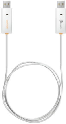
価格 2,980 円(税込) ※参考店頭販売価格

先進の wormhole switch 機能搭載！ USB 接続するだけでデータの移動、マウス、キーボードの共有ができる 『“リンクケーブルシリーズ”』 ラインナップ 『“wormhole switch JUC400”』、『“wormhole switch JUC100”』