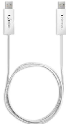
価格 1,980 円(税込) ※参考店頭販売価格

<リンクケーブル“wormhole switch(ワームホールスイッチ)JUC400”、“wormhole switch JUC100”の特徴>