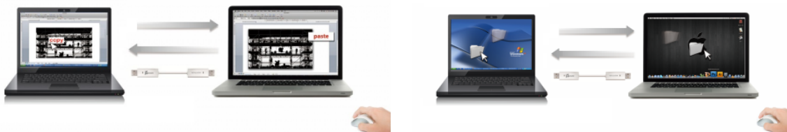
[コピーアンドペーストのイメージ]

wormhole switchで接続された2台のPC間で、コピーアンドペースト、ドラッグアンドドロップによるデータ移動が可能。写真や動画といった大容量のデータでも、外部ストレージに移したり、ネットワークに接続することなく、ストレスフリーで転送ができます。