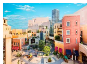
「ラ チッタデッラ」施設外観