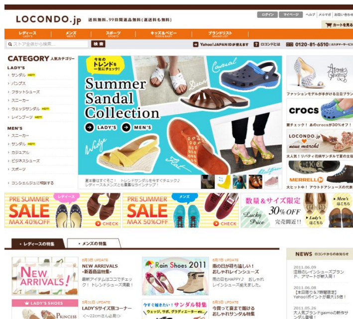
ロコンド.jp ( http://www.locondo.jp/ )

詳細につきましてはウェブサイト http://www.locondo.jp/ をご覧ください。