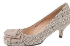
MODE ET JACOMO Mosaïque par a-bomb