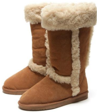
BEACH FEET DINA