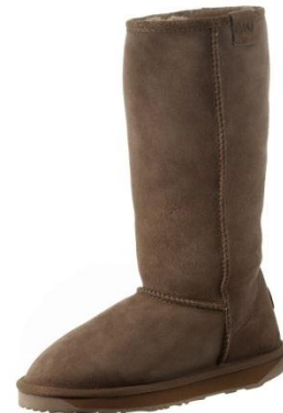
emu STINGER HI