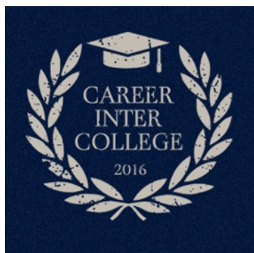
キャリアインカレロゴ