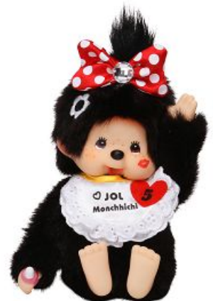
おすわり*ちゅちゅちっち