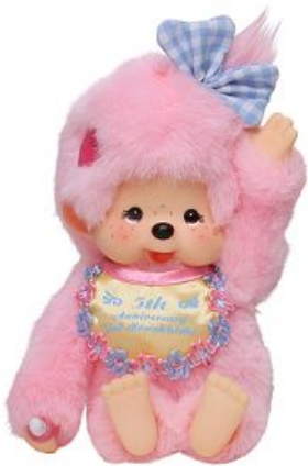
おすわり*らぶちっち

購買ターゲットの中心となる10代・20代の女性がスマートフォンやデジタルカメラで撮影をする機会が増えているという点に着目し、 持ち歩いてもらうことにプラスしてかわいく写真を撮ってもらいたいという思いから、モンチッチで初めて、耳の横と腕の部分にスナップボタンを付け、“Hi！”というポーズができるようにしました。 また、おすわりがしやすい形状になっています。ボディカラーはピンク、赤、ベージュ、黒の全4種類。カラーに合わせてデザインやメイクも変えています。