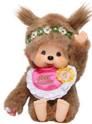
おすわり*めるちっち