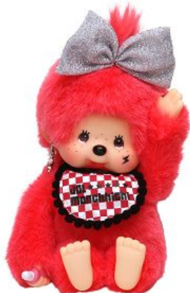
おすわり*びびちっち