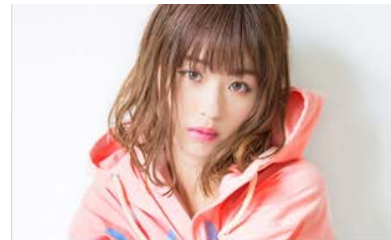
< やのあんなさん >