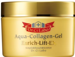
アクアコラーゲンゲル エンリッチリフトEX 120g ¥8,300(+税) / 50g ¥4,300(+税)