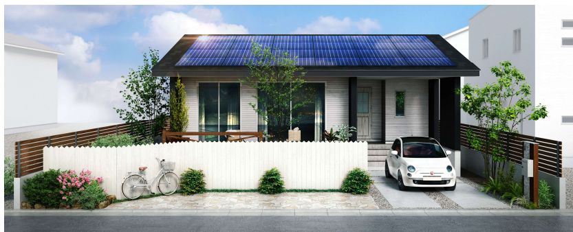
千葉県柏市にて建築中の IKI の完成イメージ

IKI の建築の様子が見られるまたとない機会です。ぜひご見学ください。詳しい所在地や見学方法などは上記方法にて来場予約後にスタッフから連絡いたします。