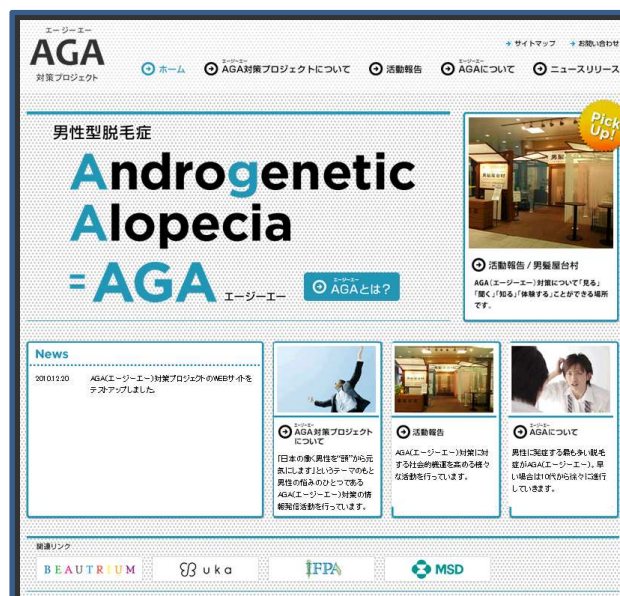
「AGA対策プロジェクト」WEBサイトTOP画面