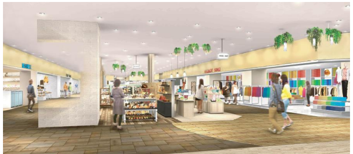
※内装写真はイメージです。

- 本件に関するメディア様からのお問合せ先 - 「ペリエ稲毛」PR事務局 (株式会社イニシャル内) 担当: 桂・鈴木 TEL: 03-5572-6062/FAX: 03-5572-6065 e-mail: t-katsura@vectorinc.co.jp