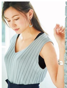
▲衿や脇の開いたデザインでも安心

カップ裏は、肌あたりのやさしい綿素材。カップサイドのキルティングパネルが脇のお肉をすっきりおさえてくれる仕様。