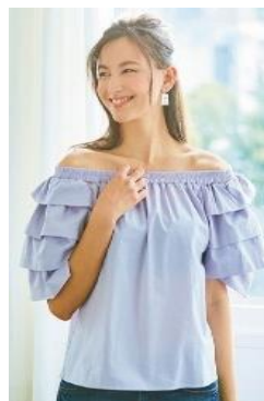
▲オフショルを快適に楽しむ

立体パターンのカップ。下辺はワイヤー入りでしっかりフィットします。バスト脇は、着脱しやすく、調整しやすい4段ホックを採用。