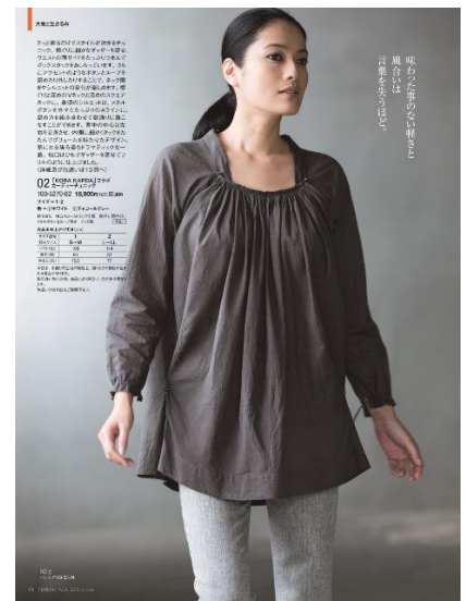
◆KORA KAPDA コラボ カーディーチュニック 18,900円（税込） http://www.dinos.co.jp/p/1296101923/ ※商品URLは2013年5月31日公開予定

ディノスはこれからも、ここにしかない魅力的なアイテムの販売を通じて、お客様一人ひとりの「歌うように、くらそう。」のお手伝いをしていきたいと考えています。