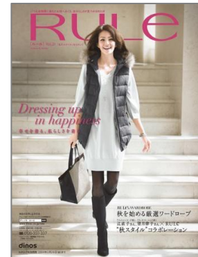
■『ルール 2013 秋冬号』 84 万部/124 ページ/A4 変形判 25 歳からのアクティブな女性に 向けたカジュアルファッション。