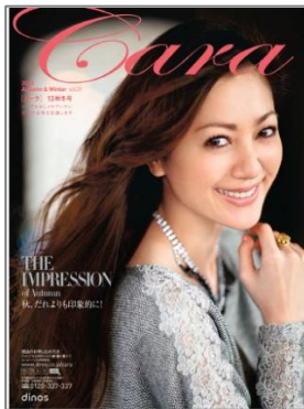
■『カーラ 2013 秋冬号』 106 万部/164 ページ/A4 変形判 上質感やしなやかな感性にこだわった 洗練リアルクローズ。

「ディノス」はこれからも、ほどよく流行を押さえながら、それだけにとどまらない上質な素材やシルエットにこだわったファッションを提供してまいります。