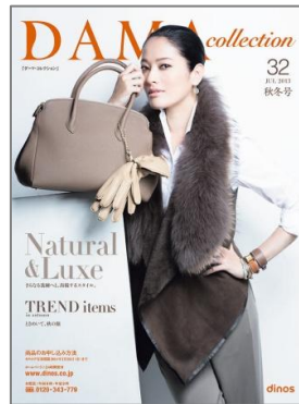
■『ダーマ・コレクション 2013秋冬号』 70万部/172ページ/A4変形判 上質の素材と大人の女性を美しく見せる シルエットの融合。