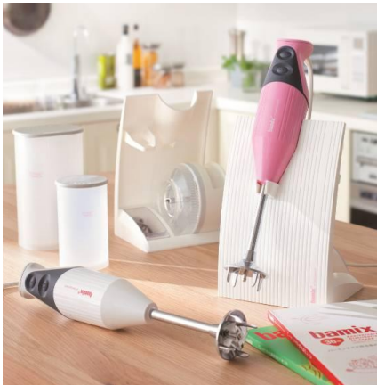
●バーミックス M300 ベーシック特別セット 27,500円 (税抜)

つぶす、刻む、泡立てるなど1台で何役もこなすバーミックスは60年以上の大ロングセラー商品。約1.5倍に引き上げたパワフルな回転力が自慢の最新機種M300が、クッキングジャグ&カップとレシピの付いたディノス特別セットで登場。さらに、ピンクはディノス限定カラーです。