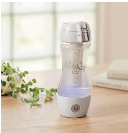
●熱湯でも使える 充電式水素水メーカーシルキー 53,000円 (税抜)

流行の水素水メーカーに、いつでもどこでも使える携帯型が登場。水はもちろん、従来難しかったお湯もスイッチひとつで熱々の水素水に変身する優れモノです。