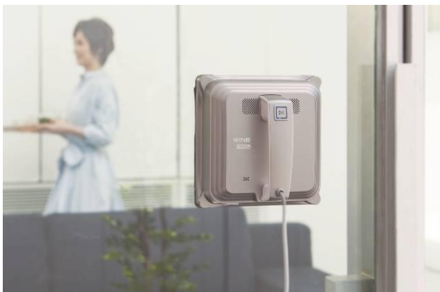
●窓拭き掃除ロボット「ウインボット」 79,800円（税抜）

スイッチひとつで面倒な窓掃除から開放してくれる窓拭き掃除ロボット「ウインボット」が新登場。内部の真空ポンプとシールユニットで、凹凸のある曇りガラスにも強力に吸着。専用パッドに含ませた専用クリーニング液が窓の汚れを浮かせ、丁寧に拭きあげます。窓のサイズを自動的に測定して、素早く効率的なコースをプログラムするので、拭き残しありません。脚立を使わなければ難しい高さの窓や、拭きづらい場所の窓にも対応します。