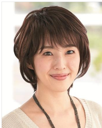
<ショートレイヤー>