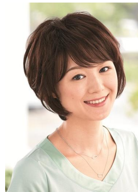
<ショートレイヤー>