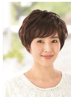
<ナチュラルショート>