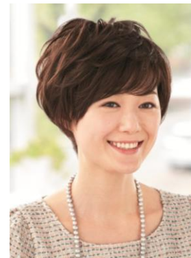
<ナチュラルショート>