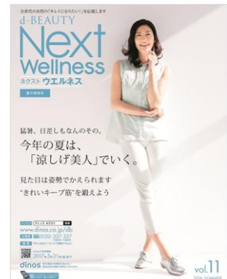
d-BEAUTY Next Wellness 2016 夏号

今号では、美肌モードの新機能を搭載した家庭用脱毛器「エクセレントデピ ビューティー ディノス特別セット」をはじめ、肩こりや猫背姿勢の原因のひとつともいえる、肩甲骨まわりの固まった筋肉をケアし美姿勢が目指せる「肩甲骨ストレッチポール アイズポール」が初登場します。その他、話題のココナッツオイルより、ココナッツ特有の匂いが苦手な人も安心して使える、無香タイプのオイル「KETO COCO(ケトココ)」や、夏のエアコンによる乾燥や紫外線にさらされた肌を潤し、メイクの上からもケアできる、ミスト状のクリーム「ディファインビューティジュエルクリームミスト」など、最新の美容キーワードをテーマとした、様々なジャンルのアイテムを販売します。