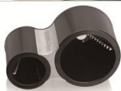
◆マイクロプレイン ヌードルカッター 3,500円（税抜）

URL： http://www.dinos.co.jp/p/1244000937/