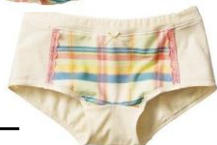
ソフトアイボリー