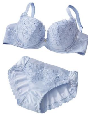
ペアショーツも展開