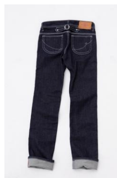
ポケットステッチに反射糸を使用