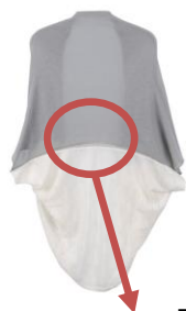
反射糸が光ります