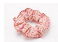
シュシュのおまけ付き