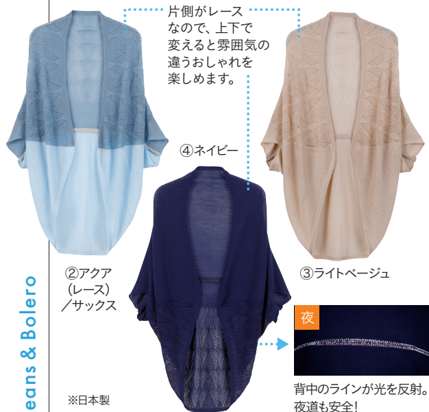
②アクア (レース) /サックス