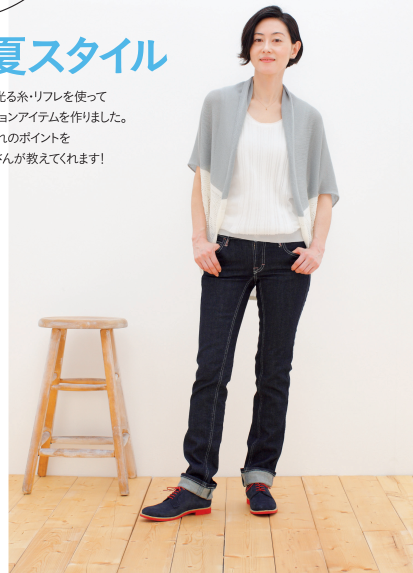
とってもおしゃれなうえに、暗闇では光をキラッと反射するすぐれもの。