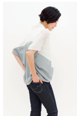
Hikariサマーボレロ (①オフ(レース)/ライトグレー)、 Hikariストレートジーンズ