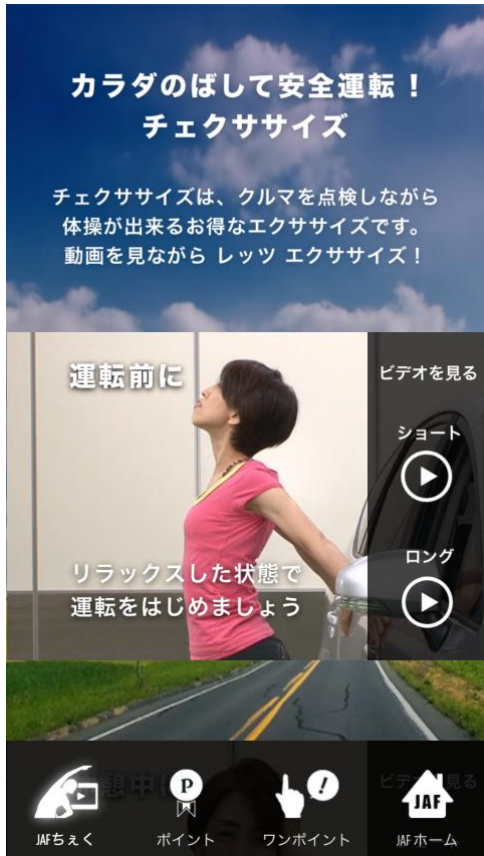
チェックササイズ