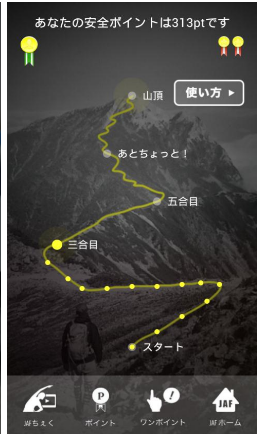
安全ポイント確認画面

このリリースへの問い合わせは以下までお願いします。 一般社団法人 日本自動車連盟 広報部 Tel : 03 (3578) 4920 Fax : 03 (3578) 4912 E-Mail:koho@jaf.or.jp URL: http://www.jaf.or.jp/ 〒105-0012 東京都港区芝大門 1-1-30 日本自動車会館