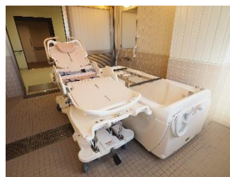
機械浴室（ストレッチャー）