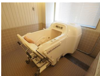
機械浴室（チェアイン）