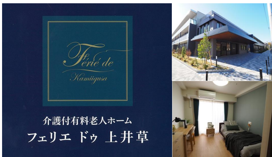
介護付有料老人ホーム フェリエ ドゥ 上井草