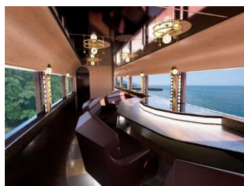
3号車車内イメージ