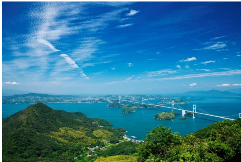
しまなみ海道と瀬戸内海

「日本の旬 四国」公式ホームページ： https://www.jtb.co.jp/nihonnoshun/shikoku/