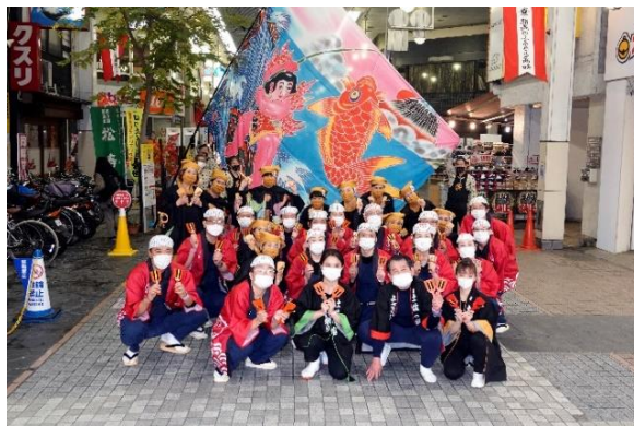
Authentic YOSAKOI(オーセンティックよさこい)

(2)四国最南端の地 神秘に満ちたパワースポット「 とうじんだば 唐人駄場」を地元ガイドとEバイクで巡る！