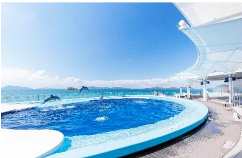
四国水族館 海豚プール

▶デジタルパンフレット https://ebook.jtb.co.jp/book/?A5519#37