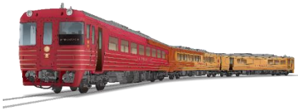
伊予灘ものがたり外観イメージ

▶デジタルパンフレット(団体旅行) https://ebook.jtb.co.jp/book/?A5462#6