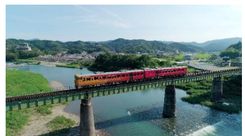
走行中イメージ(21 年度現行列車)