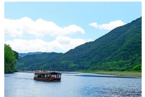
四万十川屋形船 なっとく