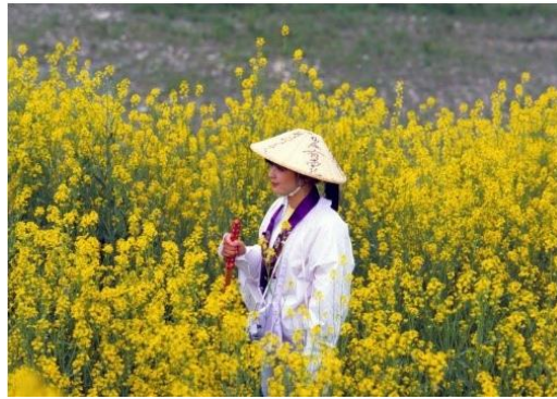
お遍路さんと菜畑