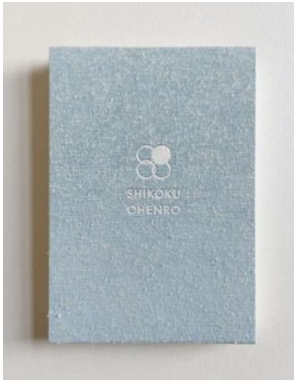
オリジナル御朱印帳イメージ