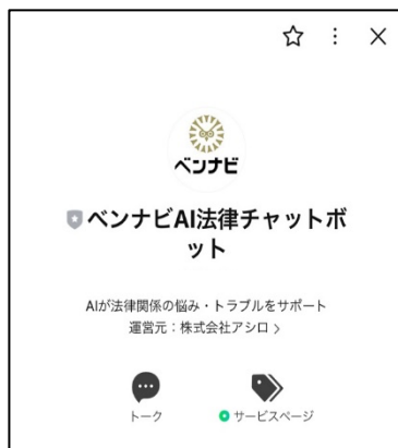
<ベンナビ AI 法律チャットボット>