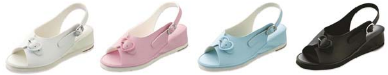
O脚ケア ハートバックルサンダル (RM-137) S・M・L・LL/2,690円

外側に重心がずれるO脚は、膝や関節負担をかけてしまいます。内側から外側にかけて傾斜をつけたインソールなら、足を寄せてくれるから重心が理想の位置に。O脚を改善してくれるので、美しい脚ラインも演出します。