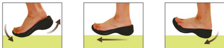
①つま先が楽に屈曲し、蹴上げをサポート ②スムーズなローリング運動 ③かかとをしっかりとホルドし、安定着地

テコの原理で快適歩行を生み出す大人気シリーズ「Re:getA（リゲッタ）」。少しの力で足がスイスイ前になるので、つまずきにくく疲れにくい設計となっています。こちらのローファーは、土踏まずのすきまを支えて負担を軽減するアーチサポート、サイドからかかとをしっかりとサポートするヒールカップ、横アーチを支えて歩きやすい中足骨サポートなど、とにかく歩行にこだわった商品です。かかと部分を踏めば、サボタイプとしても利用可能です。