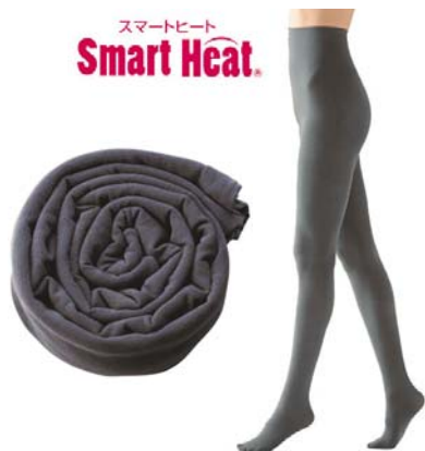
スマートヒート裏起毛ハイウエストタイツ 1,590~1,790円

厚さも暖かさもセシールNo.1のふかふか極厚タイツ。裏側起毛で毛布にくるまれているかのようなぬくもり感で、冷えが気になる季節の強い味方です。ハイウエストでお腹までしっかりあたたか。着ぶくれしなくて暖かいスマートヒート®シリーズの吸湿発熱タイツです。