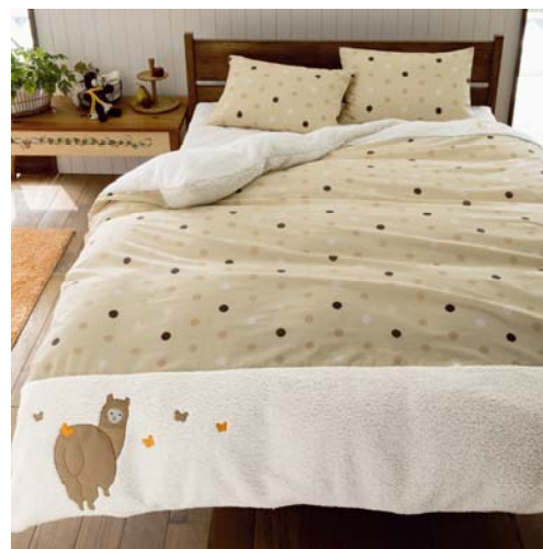
あったか掛け布団カバー（ドット） 3,990~4,990円 枕カバー（ドット） 790円

ナチュラルなカラーリングと多色のドット柄がかわいいこちらの布団カバーは、寒い冬に最適です。毛布いらずのもこもこ、ふわふわシーブ調裏ボア仕様で、布団と一体になるため毛布のようにずれません。アルパカのアプリケがほのぼのとした印象で、同デザインの枕カバーも揃い、ともに洗濯機で洗えます。