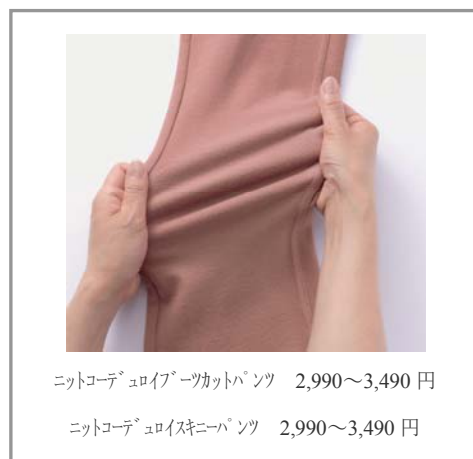
ニットコーデュロイブーツカットパンツ 2,990～3,490円

今号では、ニットコーデュロイを使用した、あったかバージョンが真冬限定で登場。見た目はまるでコーデュロイそのものですが、ニット素材なのでゴワつきがありません。ニットならではの心地よさと伸縮性があり、脚に心地よくフィットします。ブーツカットタイプとスキニータイプの選べる6色展開です。