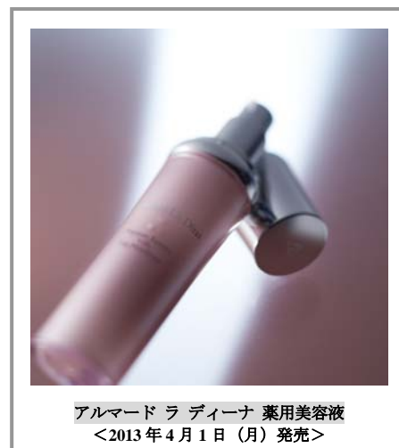
アルマード ラ ディーナ 薬用美容液 <2013年4月1日(月)発売>

エイジングケアのためのスペシャルアイテムとして、本商品をお使いいただくことで、肌の深い悩みを集中的にケアします。