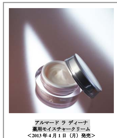
アルマード ラ ディーナ 薬用モイスチャークリーム <2013年4月1日（月）発売>

本商品は、ハリ・弾力、保湿、美白など、肌のあらゆる悩みに瞬時に働きかけ、潤い溢れる理想の透明肌に導きます。