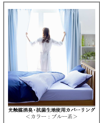
光触媒消臭・抗菌生地使用カバーリング <カラー : ブルー系>