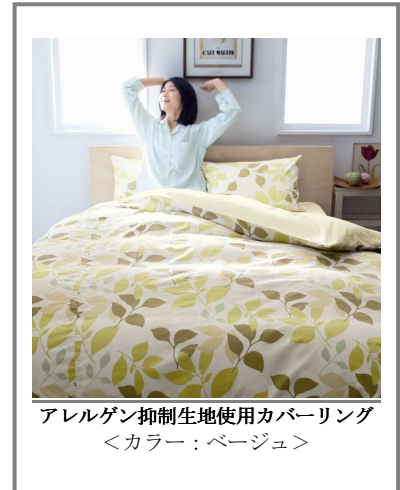
アレルゲン抑制生地使用カバーリング <カラー : ベージュ>