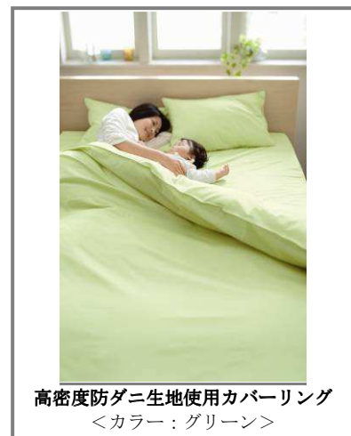
高密度防ダニ生地使用カバーリング ＜カラー：グリーン＞