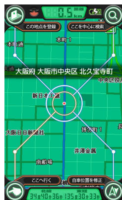
機能毎に変化する四隅のボタン