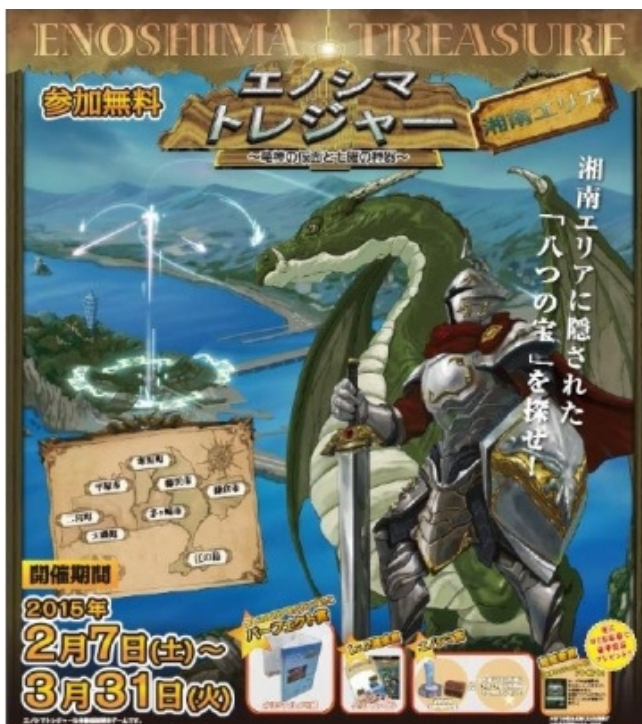
江の島で毎年開催している「エノシマトレジャー」

また、小学生を中心にゲームやアニメが大ヒットしている『妖怪ウォッチ』や月刊「コロコロコミック」で好評連載中の『怪盗ジョーカー』とのコラボレーションを実現。さらに隔月刊「最強ジャンプ」に誌面上で楽しむ宝探し漫画を掲載するなど、新たな分野に挑戦し、ファン層の拡大に繋げることができました。2015年3月には、ファンの皆さまへの感謝イベントとして、賞金100万円をプレゼントする日本最大級の宝探しフェスティバル「タカラッシュ！GP」を開催し、宝探しファン4000人と弊社の社員一同が思いっきり宝探しを楽しみ、盛り上がる思い出深い1日を過ごすことができました。