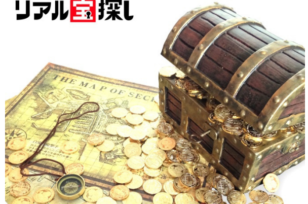
クオリティにこだわった宝箱と宝の地図