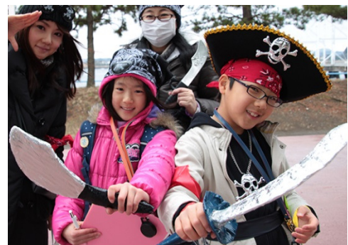
2015年3月、八景島で開催した「タカラッシュ！GP」のテーマは「海賊」