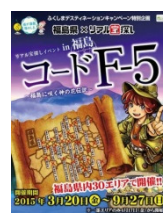
※2014年度実施イベント一例