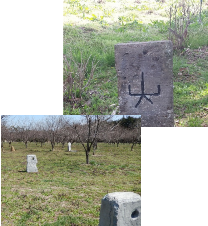
敷地内に散らばっている巨大石