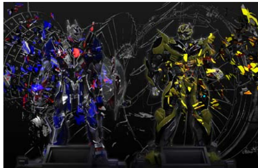
3Dプロジェクションマッピング