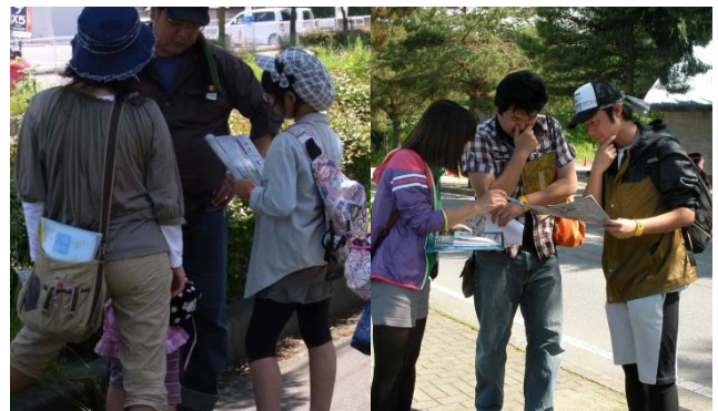
エリアごとに用意された問題と参加者風景 ※画像はイメージです。