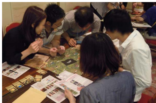
チームで力を合わせ、難解な暗号を解読！