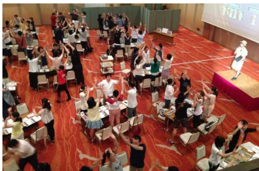
まずはウォーミングアップ！チームのみんなでハイタッチ！

難易度は大人4名が全力で取り組んでクリアできるかどうかで制作しているので、やり応え十分。また、難易度や仕組みを変更し、お子さまが中心となって一緒に楽しめるファミリー公演もあるので、老若男女どなたでもお楽しみいただけます。