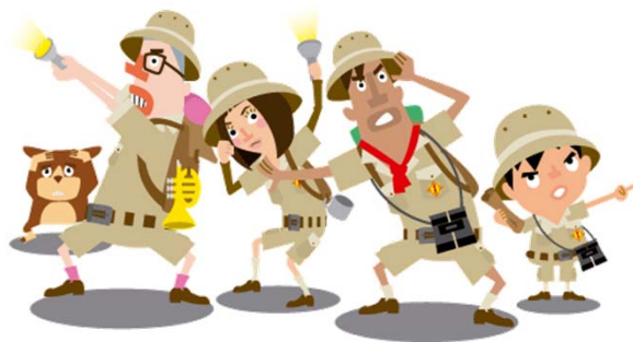
あなたの指示を待つ「現地調査班」メンバー

それらの情報やアイテムを駆使して更に解読を進め、最終的に宝物のありかを特定していく、本格的な室内型リアル宝探しイベントです。