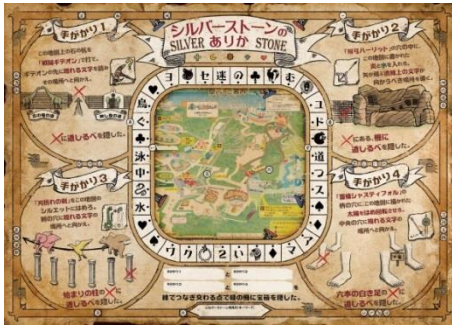
シルバーストーンの在り処を示す宝の地図

見事、村人を救うことに成功した方には、その後のエピソードを知ることができる「エンディングカード」をプレゼントします。