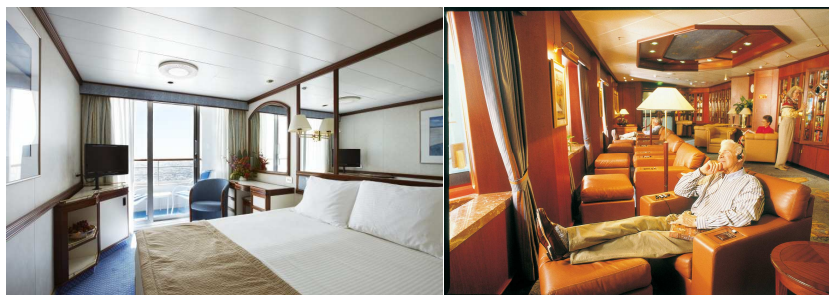
ドーン・プリンセス号船内（イメージ）