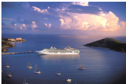
ドーン・プリンセス号

人気の豪華客船ドーン・プリンセス号へ乗船し、ポート・ダグラス周辺で皆既日食をご覧ください。船上からの観測のため、遮るものは何一つない贅沢なシチュエーションの中、ゆったりとお楽しみいただけること間違いなし！観測には欠かせない「日食グラス」付き。（※自然現象のため、必ず観測できるとは限りません。）