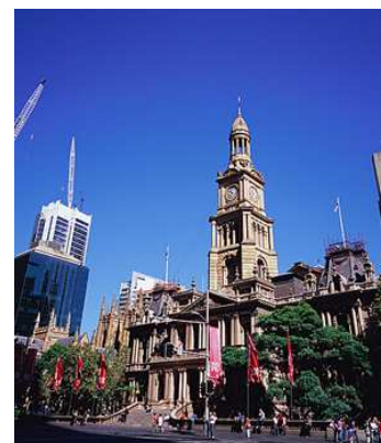
シドニーの街並み (イメージ)

滞在中、自由行動の時間に、ジャルパック流のシドニーをお楽しみいただける「シドニー虹色散歩」へ無料参加いただけます。歴史を感じる街並み、朝の公園、地元の人が集うビーチなど、日替わりのお散歩コース全7パターンをご用意。地元詳しいガイドと一緒にご案内します。この機会に是非、シドニーの魅力をご自身の足で感じてみてはいかがでしょうか！（※要事前予約）