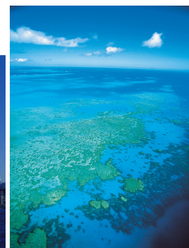
グレートバリアリーフ