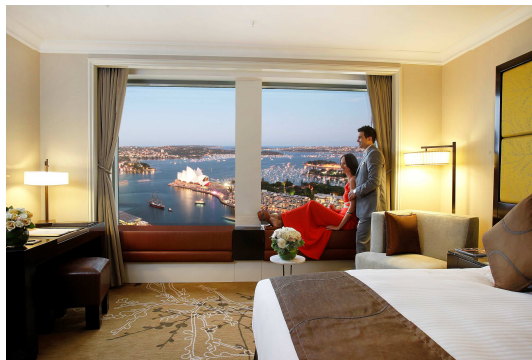
エグゼクティブ・グランド・ハーバービュー(一例)