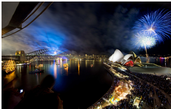
シドニー湾花火 (イメージ)

12月31日の大晦日に行われる、南半球最大級ともいわれるシドニー湾の花火を、ご宿泊のホテルの部屋からご鑑賞いただけます。オペラハウスとシドニー湾を一望できる贅沢なお部屋で、盛大な花火をゆったりとお楽しみください。