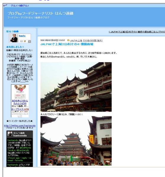
「JALPAK で上海[2日め]その4:豫園商城」