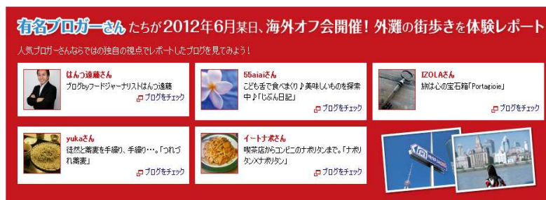
プロモーション専用ページ (一部)

当社ホームページ内に当プロモーション専用ページを作成し、そのURLをパンフレットに掲載いたしました。 これにより、パンフレットをご覧いただいた方が、スムーズにブログをご覧いただけるようになっています。