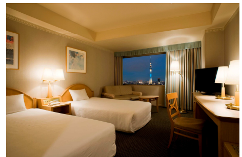
東武ホテルレバント東京 / スカイツリービュールーム (一例)