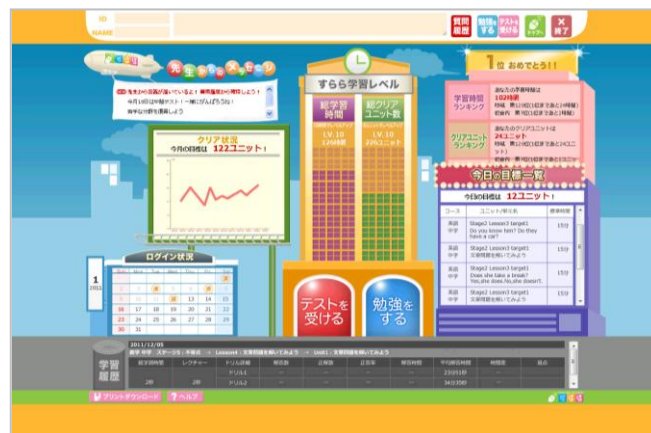
▲「すらら」トップ画面

今年度から、新学習指導要領への移行により中学校3年間の授業時間が数学で22%、英語で33%増加し、英語に至っては100時間以上も授業時間が増えました。そのため、より家庭学習が重視されるようになりつつあります。このタイミングに、本件の提供を開始することで、楽しみながら家庭学習をする習慣の定着を夏休みまでに促進したいと考えております。