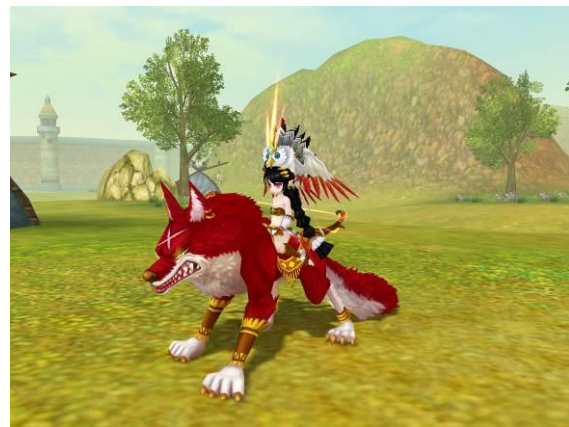
▲精霊「レパド」ゲーム内イメージ