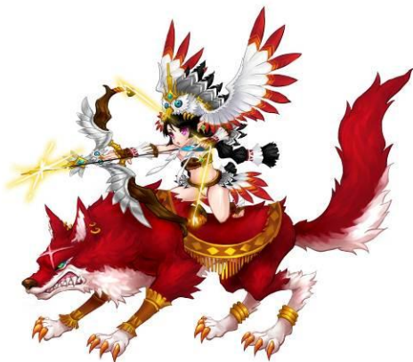
▲精霊「レパド」イラストイメージ

この度「ルーセントハート」では、英雄戦闘パートナー第5弾として、インディアンの英雄テクムセの魂が具現化した精霊「レパド」が登場いたしました。これを記念して本日より「レパド」登場記念キャンペーンを開催しております。