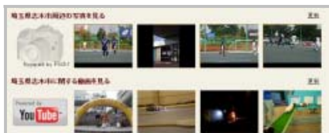
周辺エリアの動画・写真の表示例