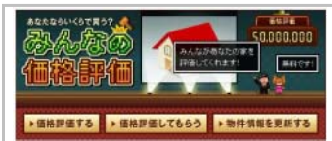
みんなの価格評価ページ

本サービスにより、情報を掲載するユーザーは不動産会社に査定を依頼することなく、自分の不動産の価格を調べることができます。また、自身が所有している不動産の適正価格を知ることで満足度を得られるほか、売却価格のシミュレーションを行うことも可能です。