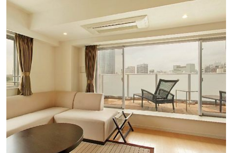
【指定物件候補】六本木デュープレックスM's ※実際のお部屋とは異なる場合があります。