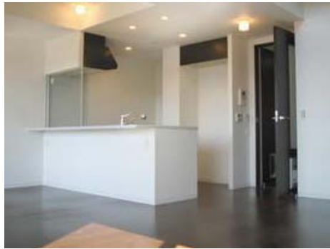
物件イメージ④ 神奈川県にある3LDKの約100㎡の物件