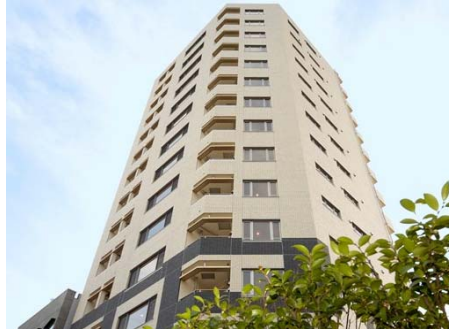
物件イメージ② 東京都にある1LDKの約60㎡の物件