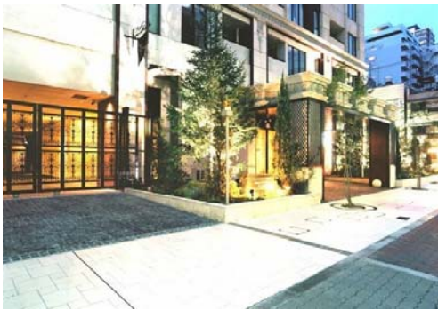
物件イメージ③ 大阪府にある2LDKの物件