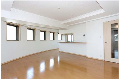
物件イメージ① 千葉県にある3LDKの物件

正解者の中から抽選で2名に『HOME'S』に掲載されている家賃20万円以内の賃貸物件に2年間住める権利が当たります。20万円以内の物件には、下記のような物件があります。