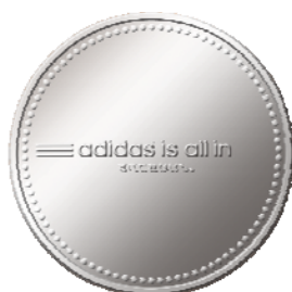
シルバーコインステッカー