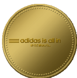
ゴールドコインステッカー