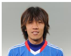
中村 俊輔 (横浜 F・マリノス)