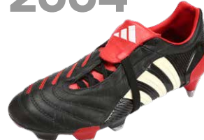
PREDATOR PULSE ブレデターパルス