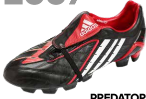
PREDATOR POWERSWERVE ブレデターパワースワープ