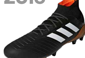
PREDATOR 18 ブレデター18