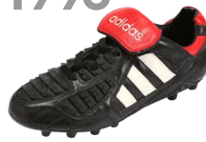
PREDATOR TOUCH ブレデタータッチ