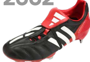
PREDATOR MANIA ブレデターマニア