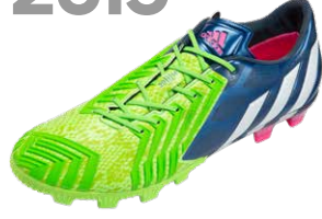
PREDATOR INSTINCT ブレデターインスティンクト