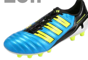
PREDATOR ADIPOWER ブレデターアディパワー