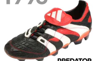
PREDATOR ACCELERATOR ブレデターアクセラレーター