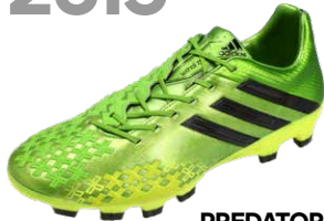
PREDATOR LETHAL ZONES ブレデターリーサルゾーン