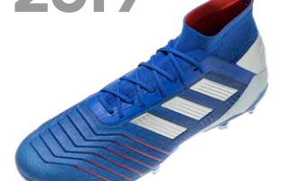
PREDATOR 19 ブレデター19

初代ブレデターの誕生は1994年。特徴的なつま先のフィン、ボールコントロール性とシュートの威力を高めるために開発されたテクノロジーで、のちにブレデターの代名詞ともなる鋭いカーブのついたシュートを生み出すことができた。歴代ブレデターは、常に斬新なデザインと先進のテクノロジーでピッチに君臨し、進化し続ける優れたボールコントロール性により、トッププレーヤーのクリエイティブなプレーを支えてきた。