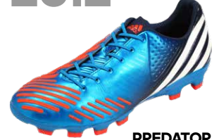
PREDATOR LETHAL ZONES ブレデターリーサルゾーン