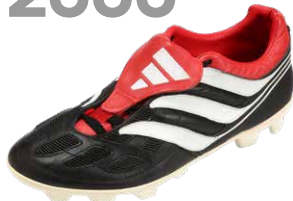
PREDATOR PRECISION ブレデタープレジジョン