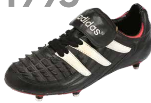
PREDATOR RAPIER ブレデターレイピア