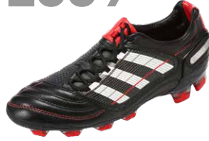
PREDATOR X ブレデターエックス