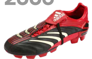
PREDATOR ABSOLUTE ブレデターアブソリュート