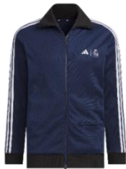
トラックジャケット 15,400 円(税込)※