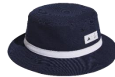
バケットハット 5,500 円(税込)※