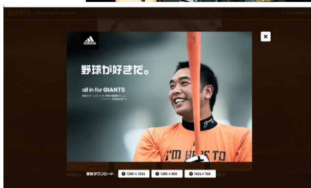
プレーヤーズ・デー特製壁紙(阿部慎之助バージョン)